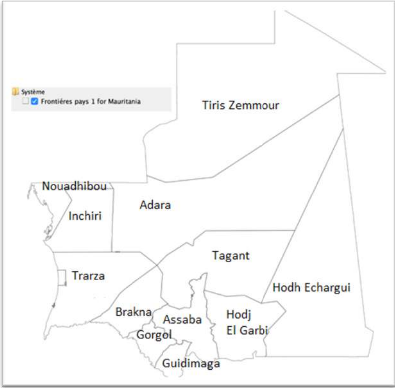
FIGURE 1 : CARTE GENERALE