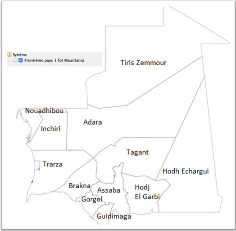
FIGURE 1 : CARTE GENERALE