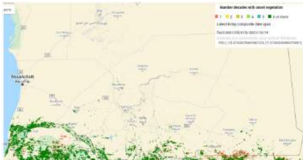
FIGURE 2 : CARTES DE VERDISSEMENT DU 11/12 AU 19/12/2021 (GOOGLE ENGINE) ABSENCE DU COUVERT VEGETAL ANNUEL DANS LA BANDE SUDE DU PAYS