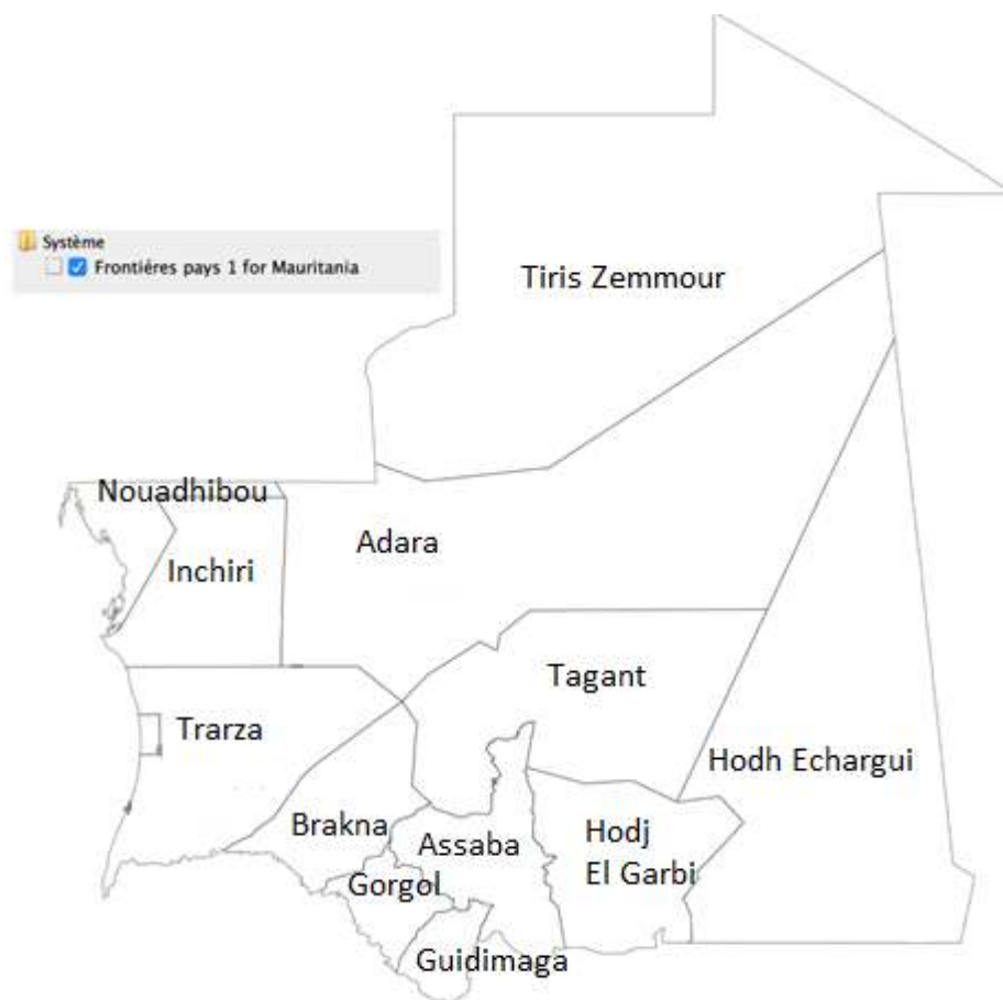
FIGURE 1 : CARTE DE SITUATION GENERALE (AUCUNE PRESPECTION N'A ETE MENEES)