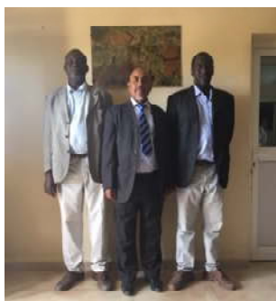
De gauche à droite :

Ces cadres qui ont contribué pleinement dans ce qui est devenu l'actuel CNLAA, ont laissé derrière eux des bons souvenirs, beaucoup d'amis et de frères.